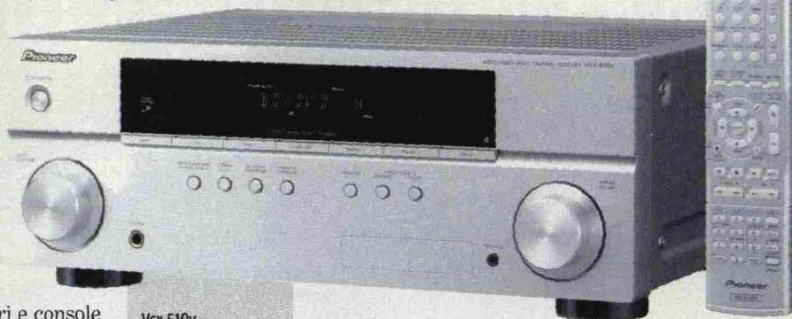
Vsx-519v Pioneer 299 euro www.pioneer.it

P artiamo dal prezzo, 299 euro, che è il dato più interessante. È quel che costa il nuovo amplificatore di fascia economica della Pioneer , nome in codice Vsx-519v . Bestione da 130 watt su cinque diversi canali, dotato di entrate digitali varie, dalle due porte hdmi a quelle ottiche, fino a quelle più tradizionali come la component, per collegarci lettori e console e godersi al meglio le colonne sonore di dvd e blu-ray. A differenza degli altri tre modelli della medesima serie, più cari, non supporta l'audio ad alta definizione e non ha l'entrata usb per iPod o iPhone. Difetti trascurabili considerando, appunto, il prezzo. Il Vsx-519v , infatti, suona bene, sorprendentemente bene. Lo abbiamo provato con diversi diffusori ProAc, Dynaudio e Kef. Tutti più costosi di due, tre o quattro volte. Certo, non è un apparecchio che può competere con amplificatori hi-fi veri e propri. Ma alla fine, se lo si adopera per ascoltare musica in mp3 e per guardare film, è la soluzione ideale. Dovete però acquistare separatamente le casse, non necessariamente cinque. Potete