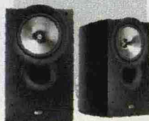
iQ30 Kef da 220 euro www2.kef.com

partire intanto dalle due frontali e ascoltare musica e colonne sonore in modalità stereofonica. Poi, nel tempo, aggiungere, se avete soldi e voglia, quella centrale, le due posteriori, il subwoofer per le frequenze basse. Tenendo presente che tanto, di qualsiasi cosa si tratti, meglio due buoni diffusori piuttosto che cinque di scarsa qualità. Partendo da questo punto di vista, la cosa più sensata è spesso comprare casse di seconda mano di qualche anno fa di marche note (Tannoy, Jbl, ProAc, Klipsch, Rogers e via discorrendo), che hanno un rapporto fra qualità e prezzo migliore rispetto a quelle più recenti. In alternativa, potete scegliere modelli come le Kef iQ30 , comunque di buon livello, che trovate in offerta a poco più di 200 euro. ☒